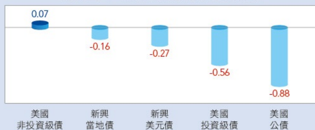
與美國十年期公債殖利率相關係數